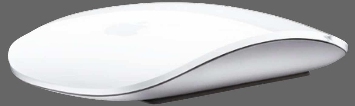
מאת: קובי אטדגי